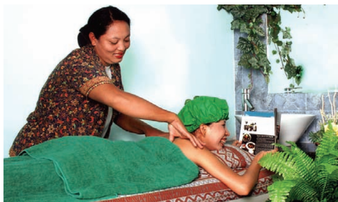
Perawatan di Hermin Salon

Banyak orang yang sudah tahu bahwa bleaching akan memutihkan kulit. Bleaching yang baik dan khusus untuk badan, adalah bleaching yang tidak akan membuat bulu-bulu tangan dan kaki anda ikut menjadi putih. Bleaching yang baik apabila dioleskan ke badan, maka badan tidak akan gatal, tidak akan kemerahan dan kulit menjadi halus, lebih putih dan lebih lembab. Hal inilah yang ditawarkan oleh Hermin Salon & Spa. Setelah badan dimassage, discrub untuk mengangkat sel matinya, badan dioleskan bleaching body, setelah itu bleaching diangkat dan dimasker. Terakhir, pasien berendam untuk mendapatkan efek relaksasi dan membersihkan sisa-sisa scrub maupun