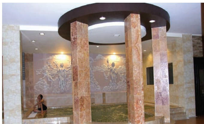
Para pengunjung menikmati jacuzzi di Metro Spa

Melalui terapi air ini diyakini dapat membantu untuk regulasi fungsi dan organ tubuh, sistem kekebalan, relaksasi serta mengembalikan vitalitas. Para pengunjung dapat memanjakan diri di Metro Spa setelah seharian beraktivitas di kantor. Para pengunjung dapat me-