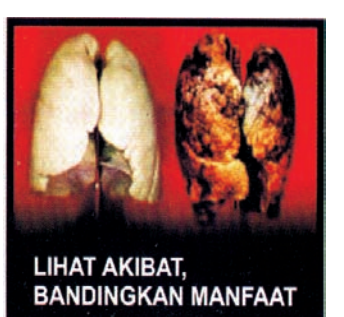
LIHAT AKIBAT, BANDINGKAN MANFAAT

juga sejak hari pertama pemakaian Smoking Card hingga hari ketiga, yaitu kebutuhan rokok akan lebih meningkat dari sebelumnya.